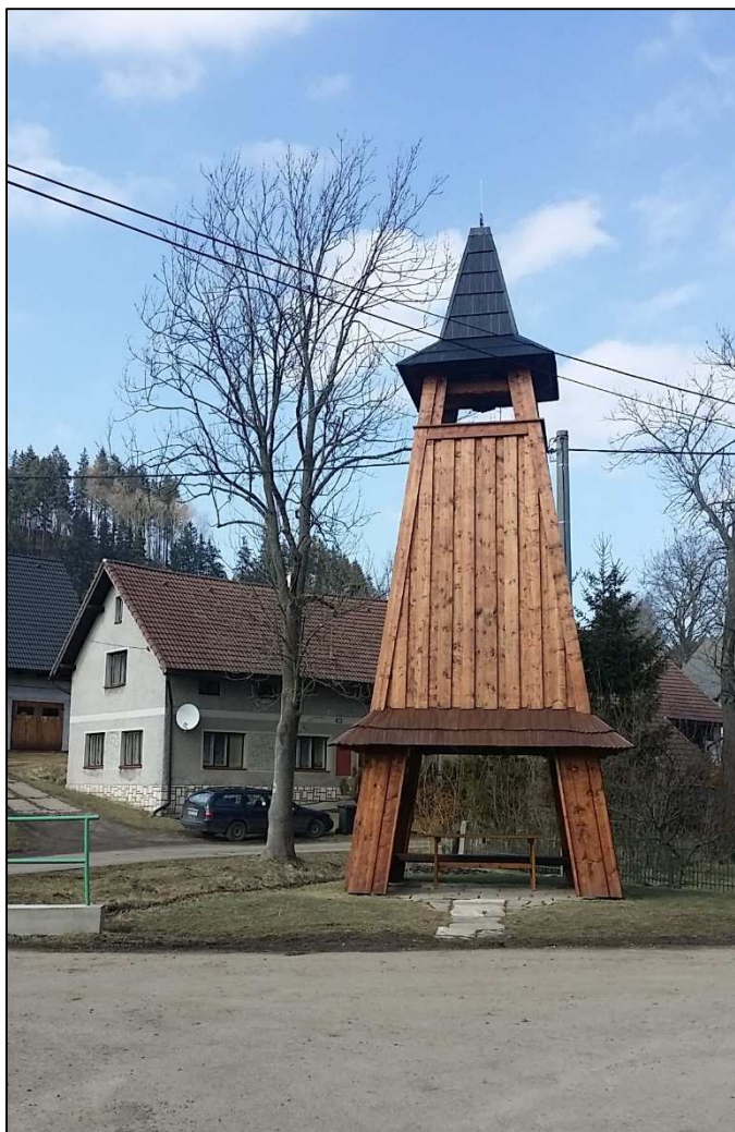
Machovská Lhota – přechod do Polska